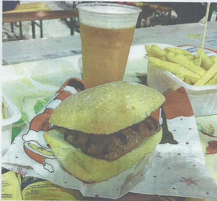
Che bontà. Immane l'appuntamento con il gusto al centro sportivo

Alle 20.30 salirà sul palco Simone Belleri, con la conclusione che verrà invece affidata al grup-